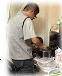
スタッフに料理を教わりながら、自炊生活にがんばっています。