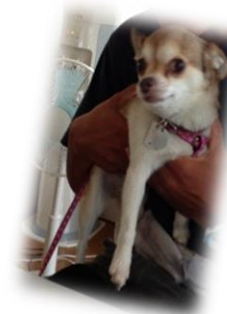
飼い主と一緒にホームレスとなっていたモモちゃん。飼い主さんが生活再建を果たすまでスタッフが自宅で預かっています。