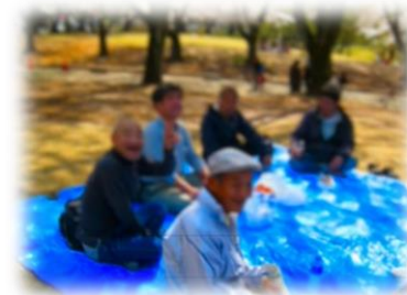
時にはみんなでお花見など